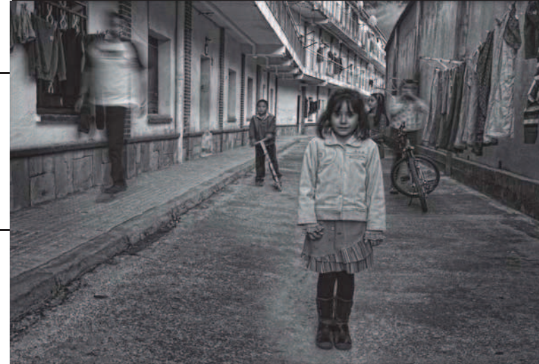
1er premi 2011 Tema A Santa Perpètua - Títol: Nenes del barri - Autor: Agustín Padilla Carreño

FESTA MAJOR D'HIVERN 2012 SANTA PERPÈTUA DE MOGODA