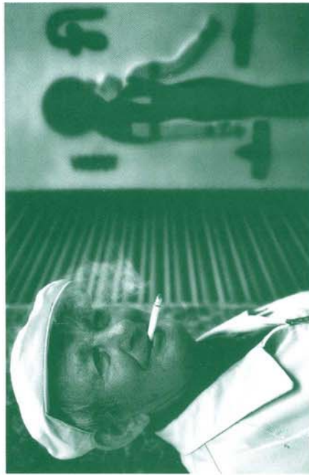
1er Premi Social Color 2009