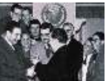
President de l'AFI 1962