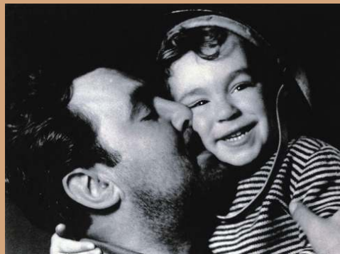
Retorn a la llar

Al Concurs Classificador de l'A.F.I. de l'any 1947, va obtenir Placa de plata i or, a la seva fotografia "Esplai"